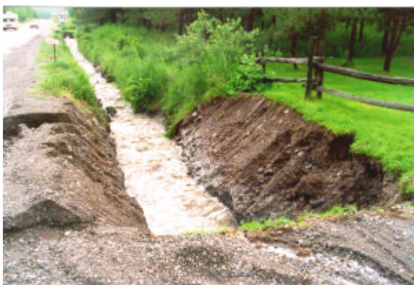
Photographie no 2 : Début de section nettoyée selon la méthode traditionnelle pour les premiers mètres, puis selon la méthode du tiers inférieur pour le reste. La photographie a été prise lors de la période de fortes précipitations de la mi-juillet 1996 et moins d'une semaine après l'intervention de nettoyage du fossé. Remarquer la forte érosion déjà en place dans les premiers mètres alors que la partie creusée selon la méthode du tiers inférieur est demeurée presque intacte. (Route 222-01-120, vue vers le sud-est)

Les avantages anticipés pour la méthode du tiers inférieur sont :