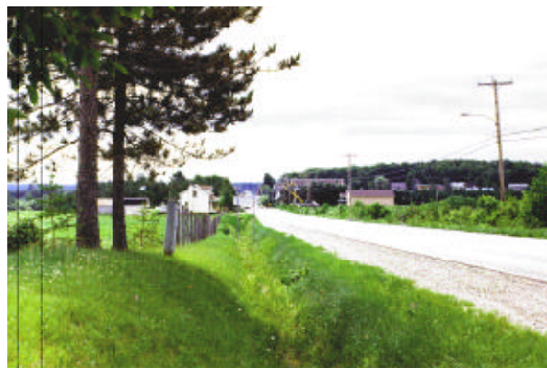
Photographie no 3 : Une route dont les fossés sont nettoyés selon la méthode du tiers inférieur s'intègre de manière plus harmonieuse dans l'environnement. Les fossés en végétation offrent une transition plus graduelle entre la route et le paysage agricole ou agro-forestier environnant.