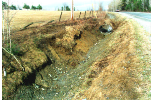
Photographie no 1 : Section nettoyée à l'été 1995 selon la méthode traditionnelle. Cette photographie prise au printemps 1996 permet de constater les effets dévastateurs de l'érosion (solifluxion et décrochage) sur les talus du fossé. (Route 222-01-140, vue vers l'est)

Toute intervention majeure dans les fossés routiers est susceptible de se traduire par des impacts négatifs sur la qualité de nos lacs. Or, la méthode traditionnelle d'entretien des fossés routiers constitue sans l'ombre d'un doute une intervention majeure. Cette méthode, rappelons-le, consiste à refaire, par excavation, la totalité du profil transversal des fossés. On se trouve ainsi à mettre à nu le fond et les talus des fossés, détruisant évidemment toute la végétation qui s'y était implantée avec le temps.