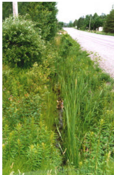
Photographie no 4 : La protection des lacs et des cours d'eau naturels commence loin en amont dans le bassin versant. Les fossés routiers constituent certainement l'un des éléments importants de la problématique, mais il en va de même de nos attitudes et de nos attentes en matière de drainage routier. Il faut à tout prix changer notre conception d'un fossé routier "propre" et s'habituer à y voir une végétation luxuriante.

À ce stade de l'expérimentation, le bilan environnemental et économique de la méthode du tiers inférieur surpasse largement celui de la méthode traditionnelle. Un suivi prolongé sera cependant nécessaire afin de mieux évaluer les contraintes nouvelles qui pourraient surgir du fait de laisser la végétation en place, entre autres au niveau de l'entretien hivernal et de la fréquence du débroussaillage.